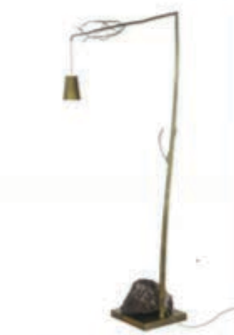
Brand van Egmond